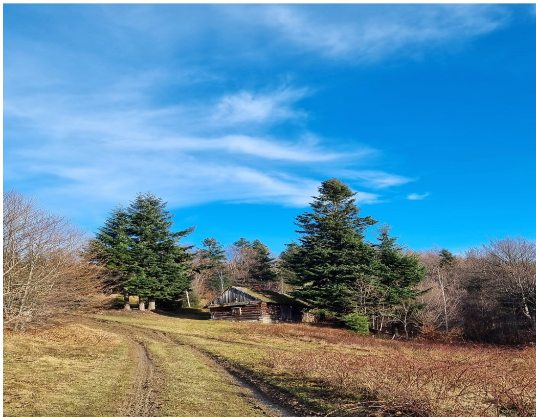
Lachów Groń wejście od Koszarawy z tradycyjną zabudową samotniczą