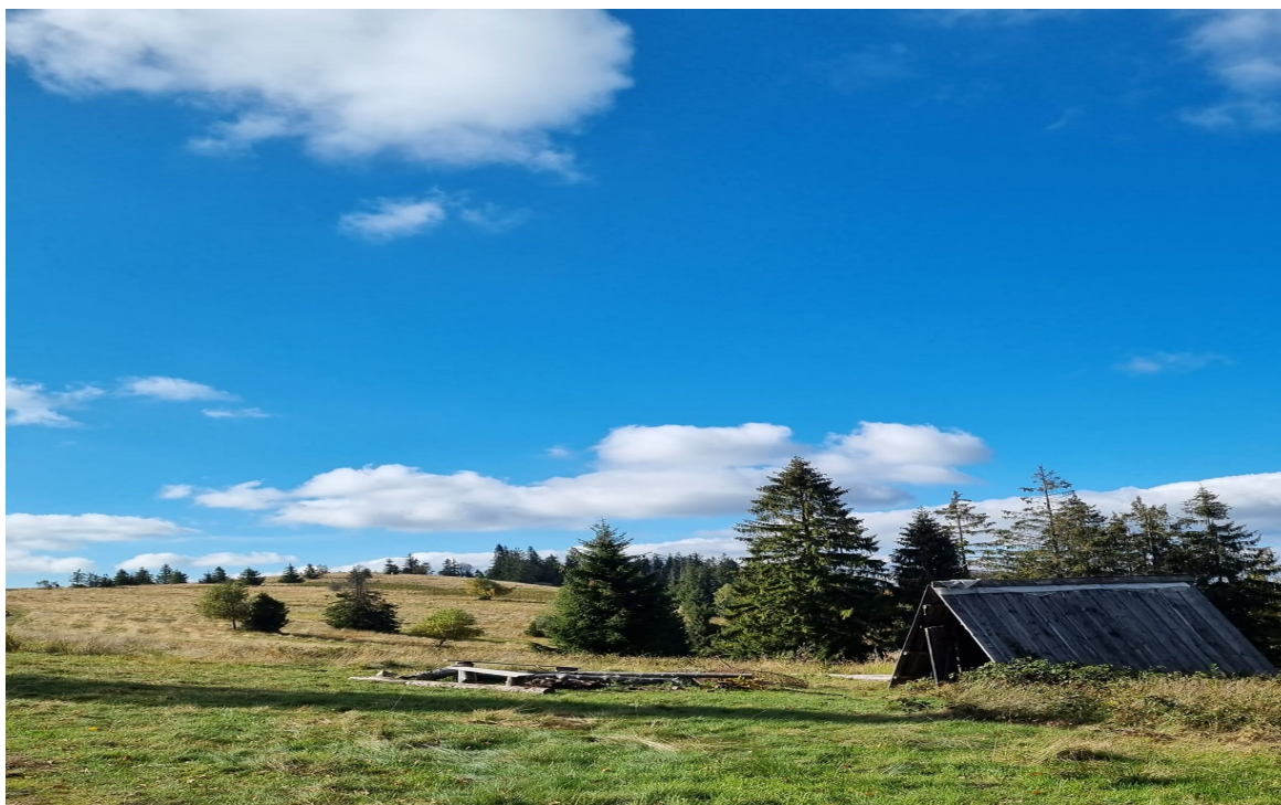
Tradycyjna architektura związana z wypasem zwierząt na Hali Janoszkowej